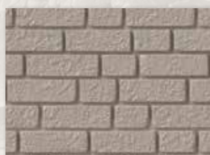
Natural Clay (008)