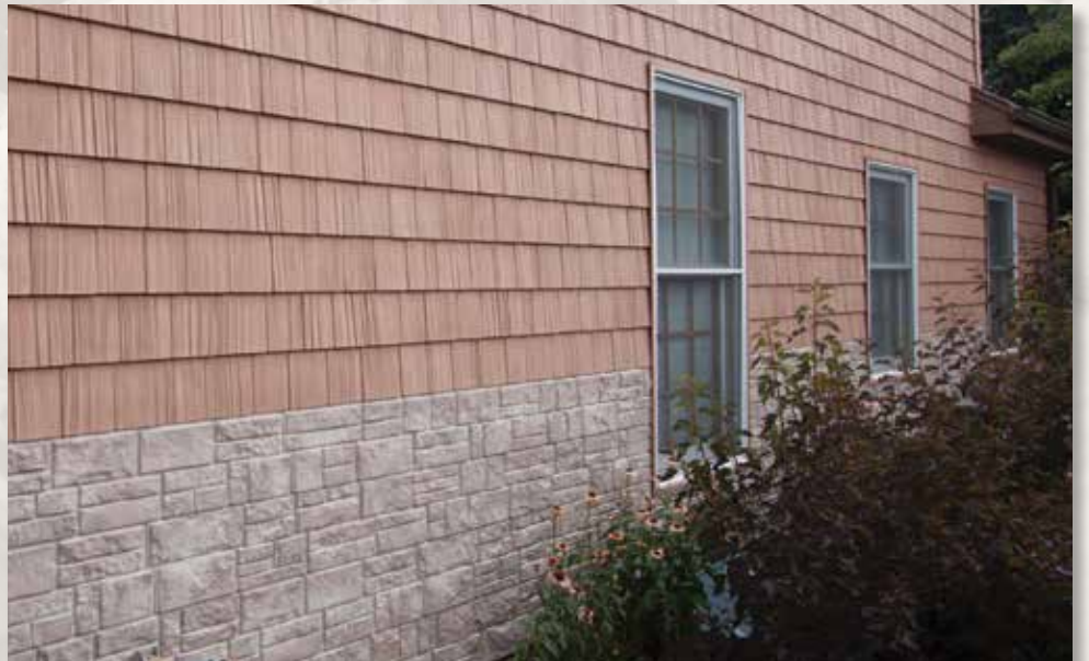
Limestone, Mesa (853); Split Shake 7" (178 mm), Rustic Brown (828)