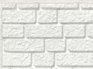
Glacier White (123)