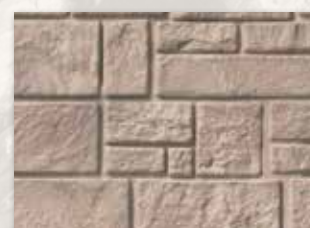
Red Rocks (852)