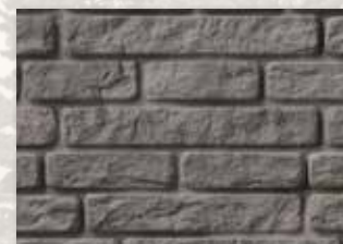
Dover Crest (886)