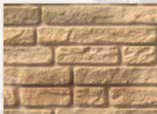
Durham County (885)

Disponible en modèle 10" (254 mm), ce décor populaire et versatile est proposé en quatre coloris avec un esthétisme qui attire tous les regards. Que ce soit des murs complets, des soubassements et d'autres applications, nos bardages Limestone donnent une apparence de maçonnerie robuste, taillée et posée à la main. Le caractère subtil de la surface et son relief remarquable complètent une large gamme de choix de bardages.