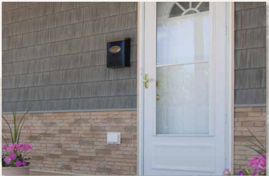
Stacked Stone, Durham County (855), Split Shake 7" (178 mm), Vintage Green (823); Mid-America Volets Louvre, Black (002)