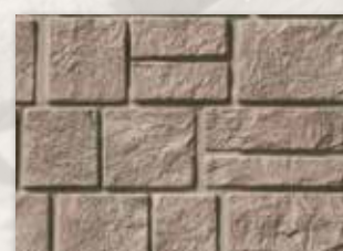
Desert Canyon, (851)